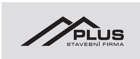
černé provedení na velmi světlém podkladu

Pokud potřebujeme logo použít na barevném podkladu, preferujeme bílé nebo stříbrné provedení. Pokud je nutné značku umístit na velmi světlý jednobarevný podklad a není možné použít plnobarevnou variantu, tak z hlediska co nejlepší čitelnosti zvolíme logo v černém provedení. Vždy dbáme na dobrou čitelnost.